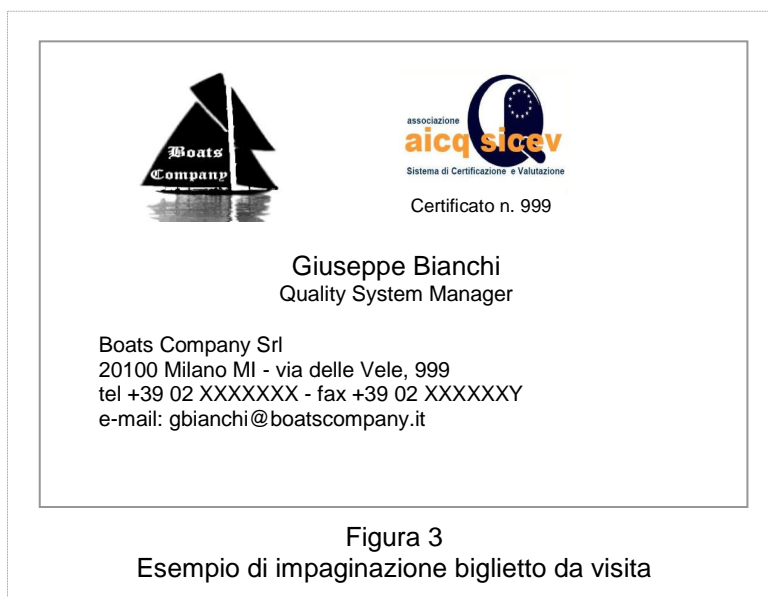
Figura 3 Esempio di impaginazione biglietto da visita

È ammesso l'utilizzo di un altro colore per abbinarsi al colore dei caratteri del testo presente sulla carta intestata e/o sui biglietti da visita e/o sito web. L'abbinamento è ammesso solo con il colore dei caratteri utilizzati nel testo e non con uno o più colori eventualmente presenti nel logo dell'Organizzazione di cui si fa parte.